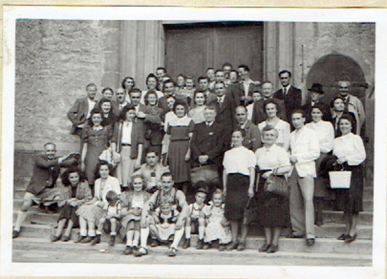
— Vor der Stadtkirche in Weiskirchen —