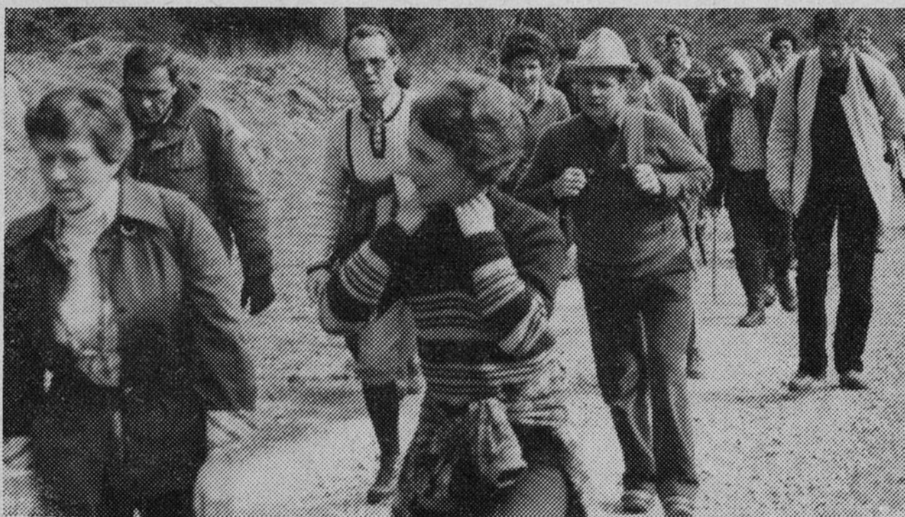
Unser Bild zeigt Wanderer auf dem Weg von Wertheim nach Freudenberg.