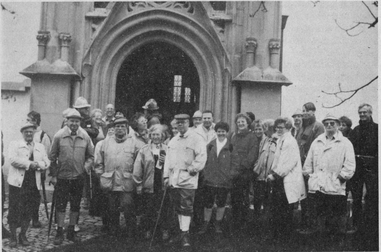
Eine Wandergruppe des Spessartvereins an der Wallfahrtskirche „Maria im Weingarten“ bei Volkach

Ein milder Winter, ein früh einsetzender Frühling, ein herrlicher Sommer und ein goldener Herbst waren gute Voraussetzungen für unser Jahresprogramm. Wer alle Angebote ausschöpfte, konnte mit dem Spessartverein im Süden das Nördlinger Ries und Tirol, im Westen den Neckar und den Odenwald, im Norden den Kahlgrund und den Hahnenkamm im Spessart und im Osten den Raum Volkach und das Fichtelgebirge kennenlernen.