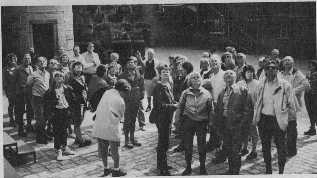
Besichtigung der Feste Rosenberg in Kronach während der Pfingstfahrt in den Frankenwald.

Wer im Jahr 1990 an allen Wanderungen teilnehmen wollte, der hatte bereits 27 Termine in seinem Kalender stehen. So prall voll war der Wanderplan der Spechte. Die Angebote beschränkten sich nicht nur auf die nähere Umgebung, sondern auch auf entferntere Gebiete. Im Norden war es der Spessart, im Osten der Frankenwald und Bayerische Wald, im Süden das österreichische Bundesland Tirol und im Westen der Odenwald und die Pfalz.