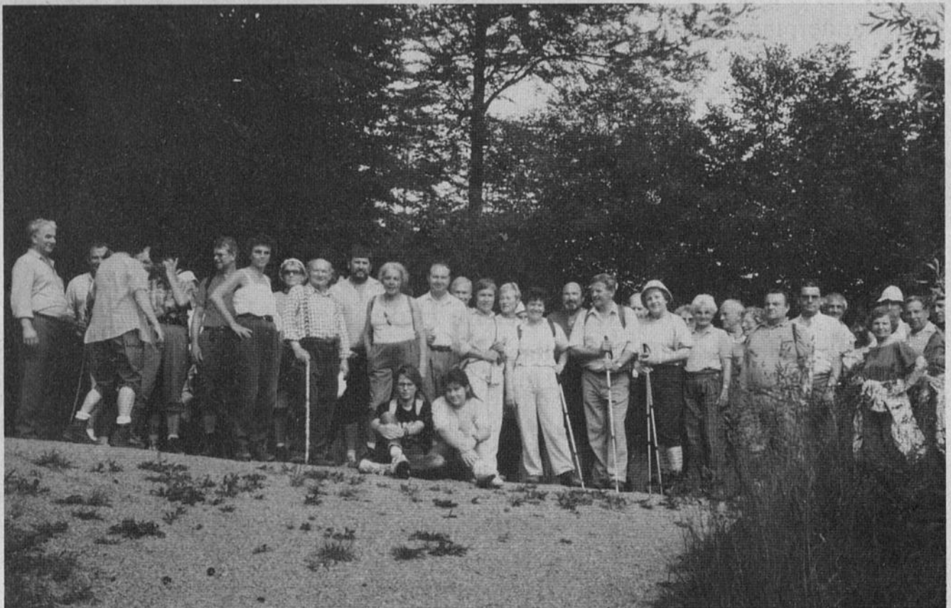
Die Wandergruppe des Spessartvereins bei einer Tagestour in den Löwensteiner Bergen

Ein erlebnisreiches Vereinsjahr ging zu Ende. Daher ist es angebracht, heute noch einmal zurückzuschauen auf die Wanderungen, Fahrten und Veranstaltungen. Die erste planmäßige Wanderung führte nach Werbach. Dann folgte Eiersheim. Durch Wald und Feld wurde im südlichen Landkreis vor Bernsfelden durch den Harthäuser Wald nach Igersheim gewandert. Der Fasching ist durch den Krieg im Nahen Osten ausgefallen. Eine Wanderung mit Helau nach ? war jedoch gut besucht. Den ersten Hauch vom Frühling konnten die Spechte bei der Tour von Walldürn nach Rippberg erleben. Bei herrlichem Wetter wurde eine Tagestour vom Main zur Tauber im Monat März durchgeführt. Bei der Osterwanderung kamen wieder die Kinder auf ihre Kosten. Das nächste Wanderziel war Wittighausen.