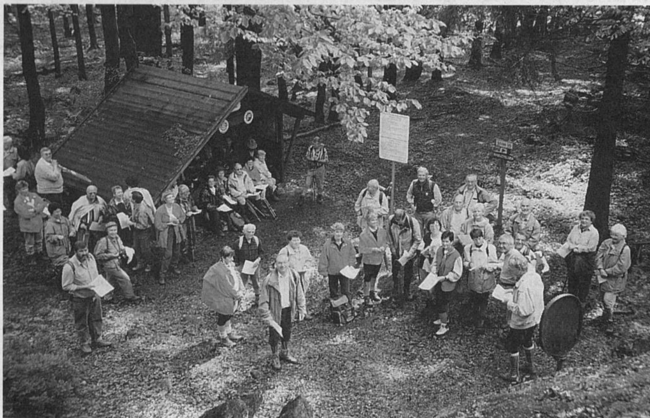
Eine Wandergruppe des Spessartvereins bei einer Pfingstandacht am Grenzübergang für Wanderer „Dreiwappen“ bei Waldmünchen.

Der Auftakt der Wandersaison war die Dreikönigswanderung nach Werbach. Eine winterliche Wanderung folgte von Steinbach bei Kilsheim über Breitenau und den Schächerstein zur Wohlfahrtsmühle bei Hardheim.