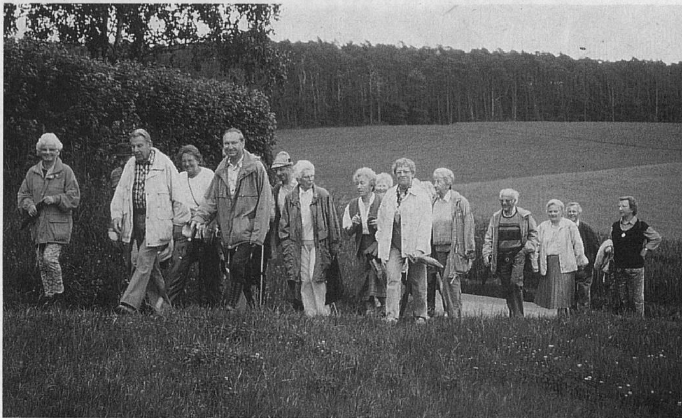
Die Mittwochswanderer auf einem Höhenweg bei Dienstadt.