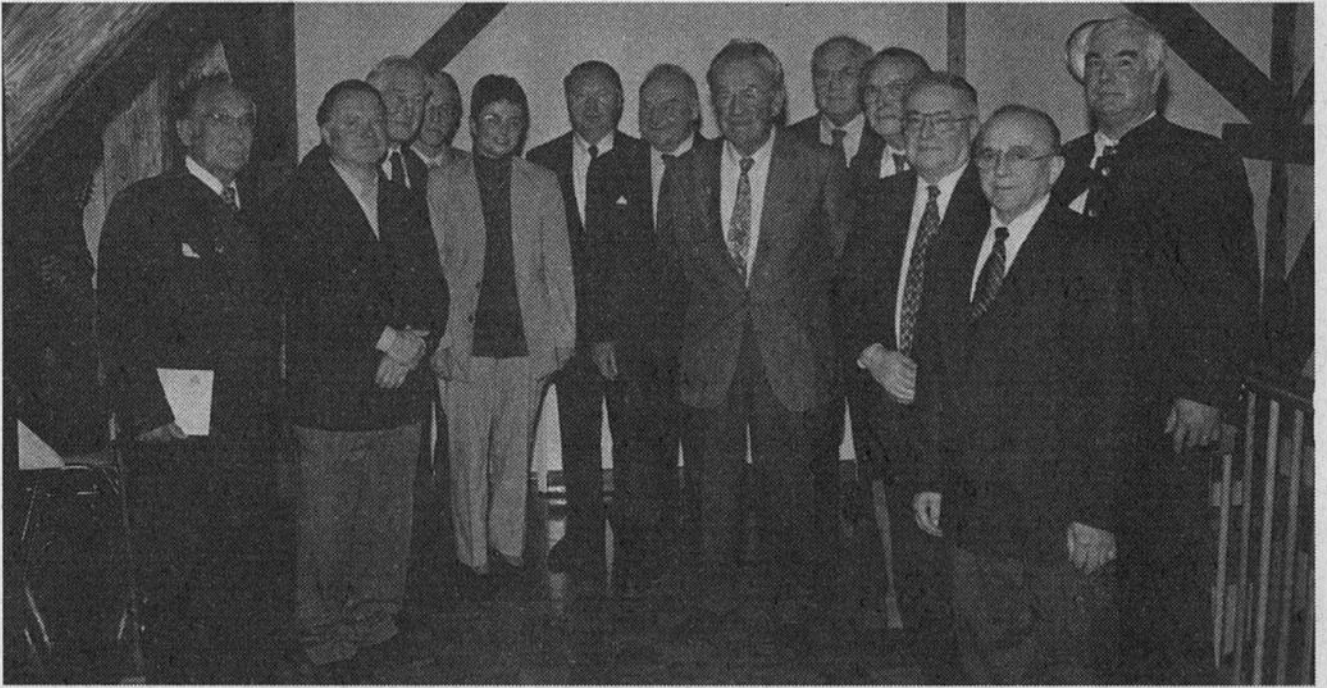
Zahlreiche Ehrungen standen im Mittelpunkt der Hauptversammlung des Spessartvereins Tauberbischofsheim. Die Geehrten (Bild) erhielten kleine Präsente und Ehrennadeln.

bescheinigt hatte, konnte dem gesamten Vorstand einhellige Entlastung erteilt werden.