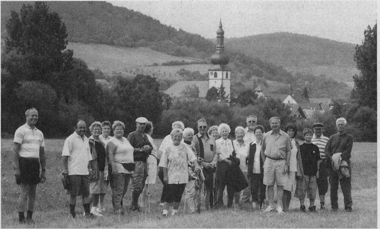
Mittwochswanderer auf dem Weg nach Hochhausen.