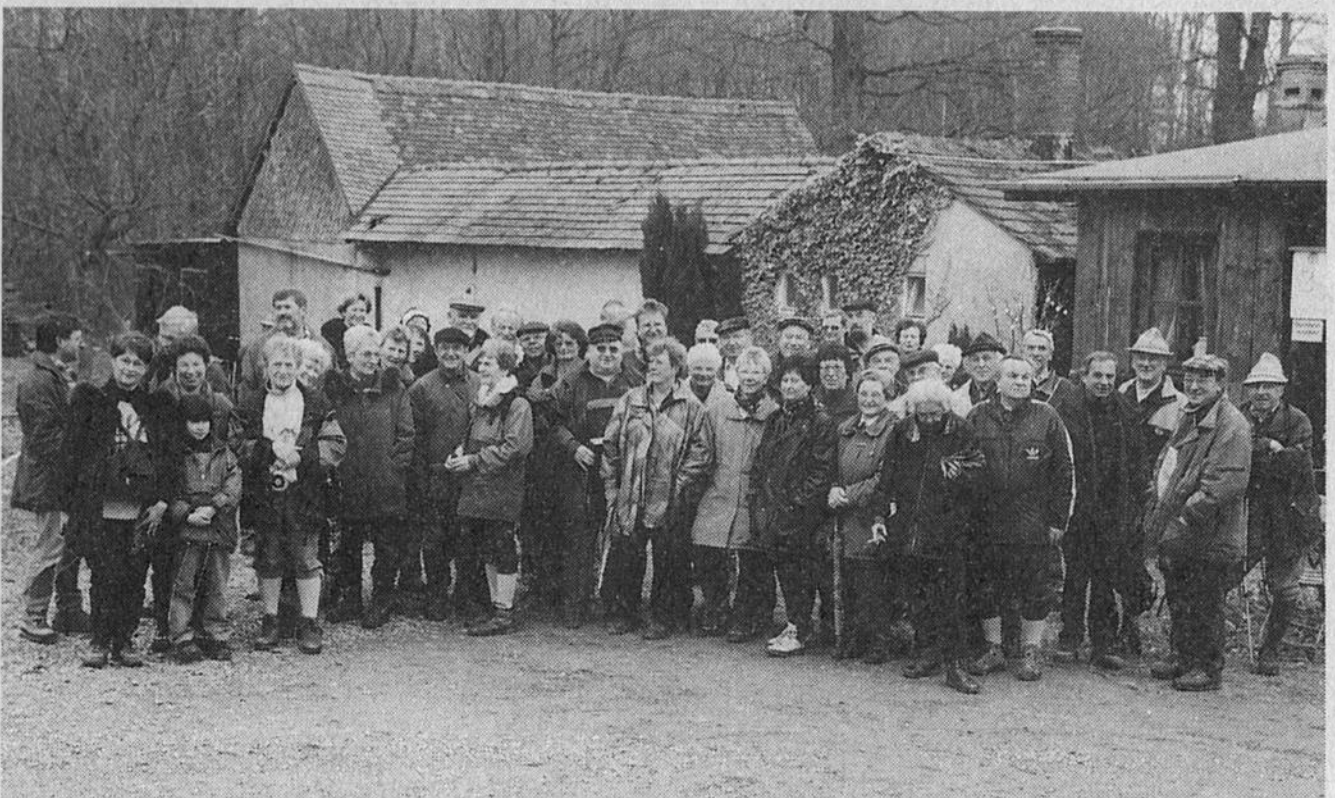
Tauberbischofsheimer Spechte auf der Karlshöhe im südlichen Spessart.

Gemeinsam mit dem Heimatverein wurde im März wieder eine Gemarkungswanderung in östlicher Richtung durchgeführt. Bei einer Hüttentour lernten die Teilnehmer