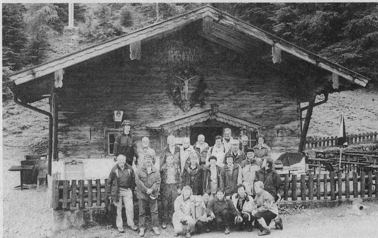
Wandergruppe vor der Falzthurnalm

Die Gruppe 2 fuhr mit dem Bus zum Fuß des Feilkofels und wanderte steil ansteigend zum Feilkopf auf eine Höhe von 1562 Metern. Die Wanderer freuten sich über die gute Aussicht in das Rofangebirge und in die Karwendeltäler. Am Gipfelkreuz des Feilkopfes angekommen, war das wunderschöne Panorama die Belohnung für