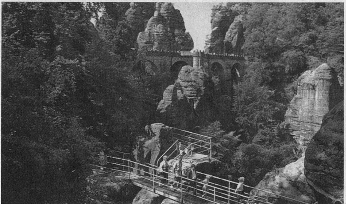
Die Landschaft der Sächsischen Schweiz

Diese Geschehnisse konnten die „Spechte“ auf ihrer zweiten Etappe nachvollziehen. Vom historischen Hochofen ging es über den Nachbar, Sachsenstein und Johannes-