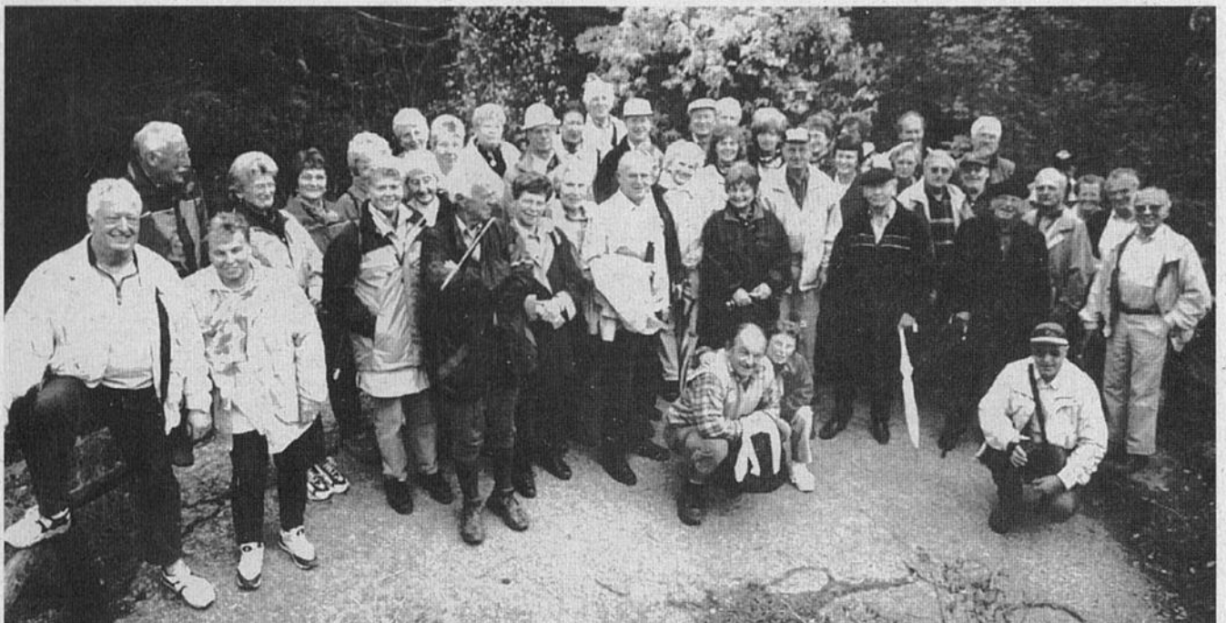
Die Mittwochswanderer im Felsenlabyrinth Luisenburg bei Wunsiedel im Fichtelgebirge

Immer beliebter sei auch der jährliche viertägige Wanderausflug, der die Mittwochswanderer nach Masserberg im Thüringer Wald führte. Hier unternahm man ausge dehnte Wanderungen auf dem berühmten Rennsteigwanderweg, wanderte auf Goethes Spuren auf den Kickelhahn hinauf, einem bekannten Aussichtsberg dieses