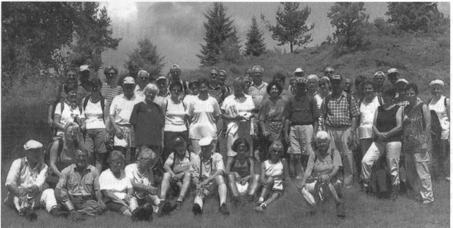
Die Spechte am Felsenlabyrinth bei Stadlern in der Oberpfalz (Pfinsten 2003)

Als nächste Wanderung stand in Unterfranken Retzbach - Retzstadt - Retzbach auf dem Programm.