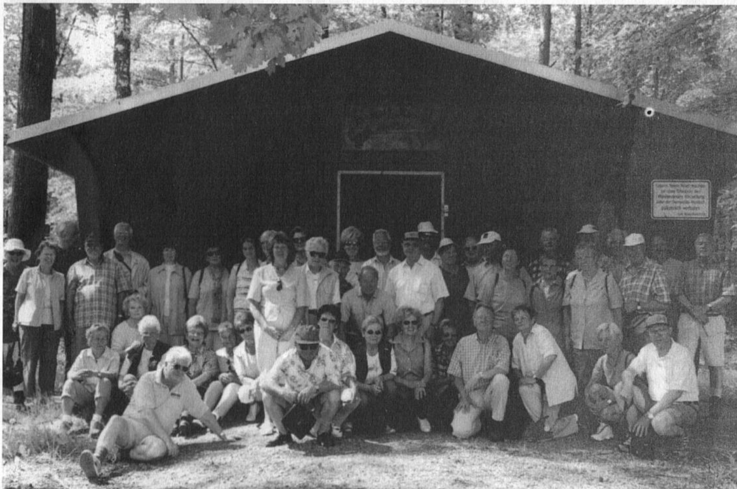
Die Mittwochswanderer an einer Schutzhütte auf der Klosterhöhe bei Hasselberg im Spessart.

Im beiliegenden Wanderplan sind die vorgesehenen Wanderfahrten für das Jahr 2004 unter der Überschrift „Mittwochswanderer“ zu finden.