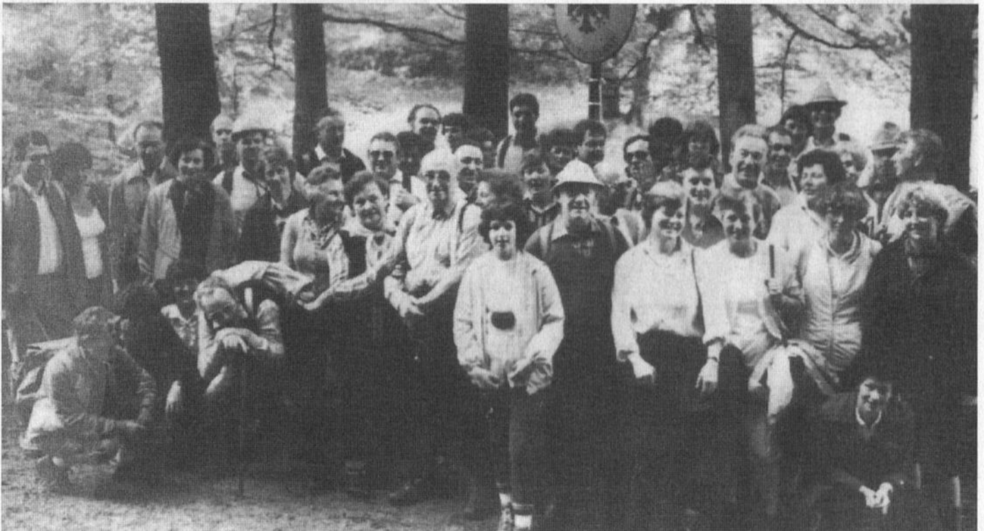
Im Pfälzer Wald – Pfingsten 1983