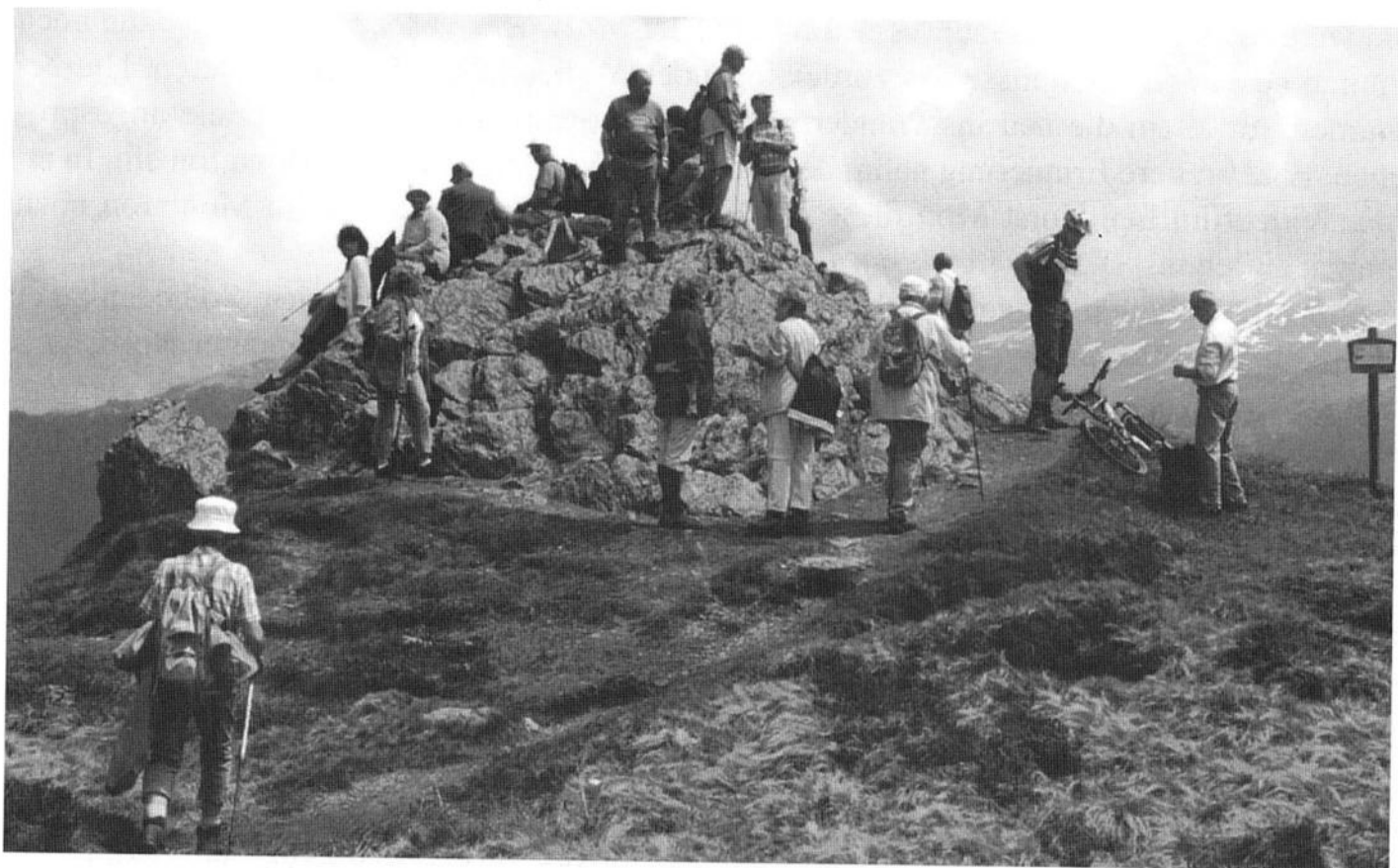
Mittwochsspechte am Aussichtspunkt Somerbleis, 1990 m