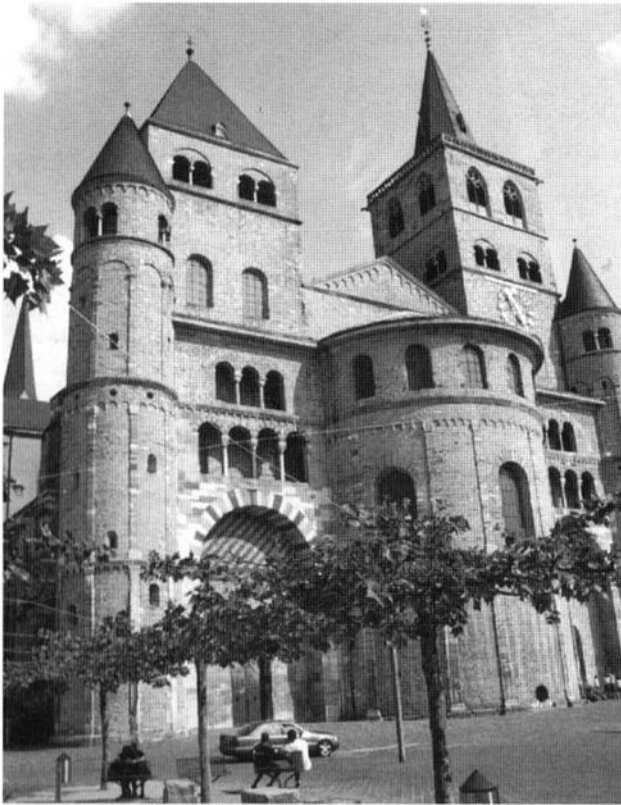
Der Dom in Trier