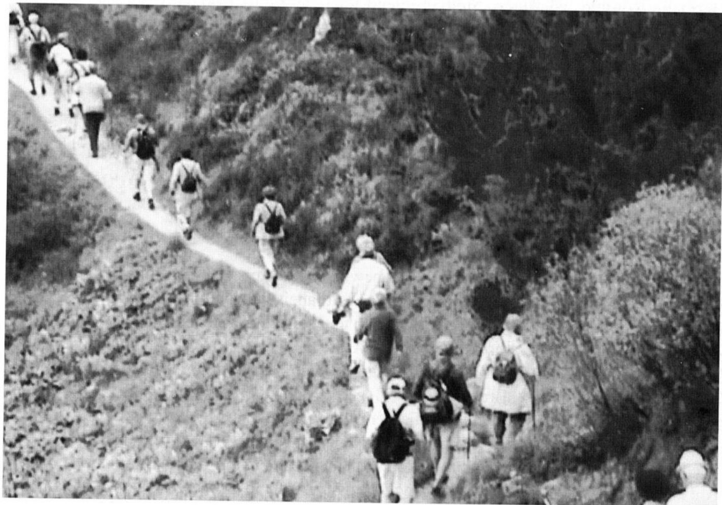
Spechte im Montafon auf dem Weg zur Lindauer Hütte