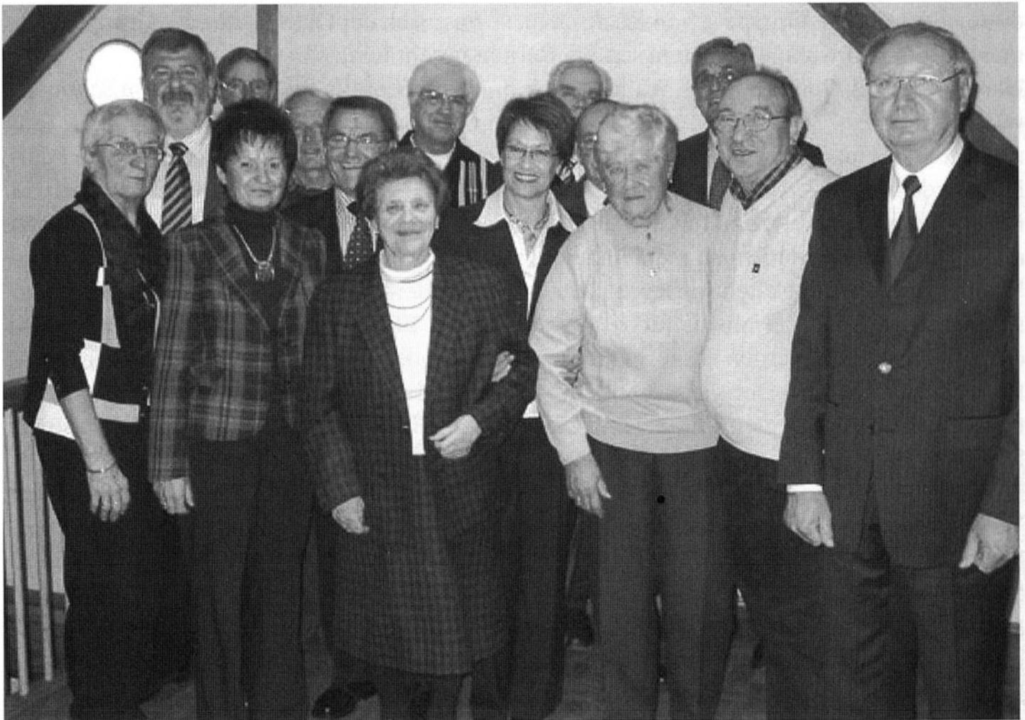
Bei der Jahreshauptversammlung des Spessartvereins Tauberbischofsheim wurde eine große Zahl Mitglieder für langjährige Vereinszugehörig geehrt.

Nach diesem offiziellen Teil schloss sich eine gemütliche Adventsfeier an, bei der Nikolaus „Horst“ feststellte, dass auch von „hoch oben“ die kleinen Missgeschicke der Wanderfreunde aufgezeichnet werden und gab manche Anekdote zum Besten.