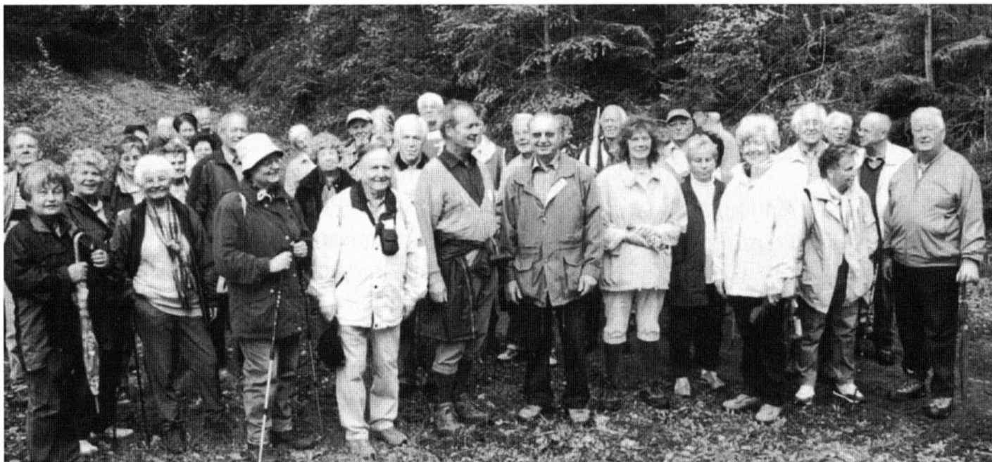
Mittwochswanderer im Vorhof der Burg Freudenberg am 27. April 2005