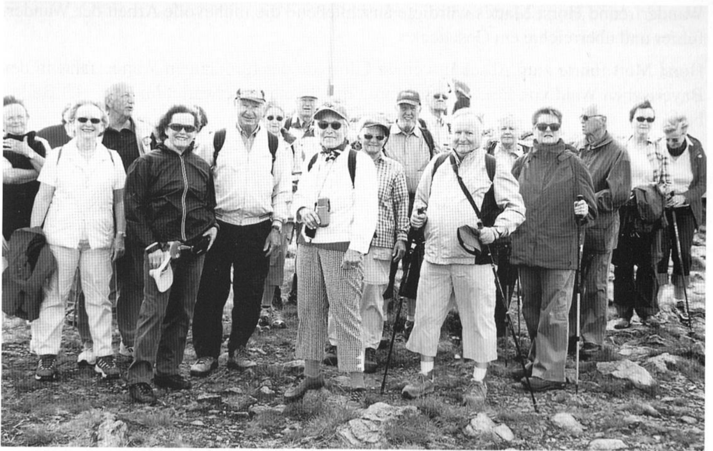
Gut ausgerüstete Mittwochsspechte auf dem Arbergipfel (1456 m)