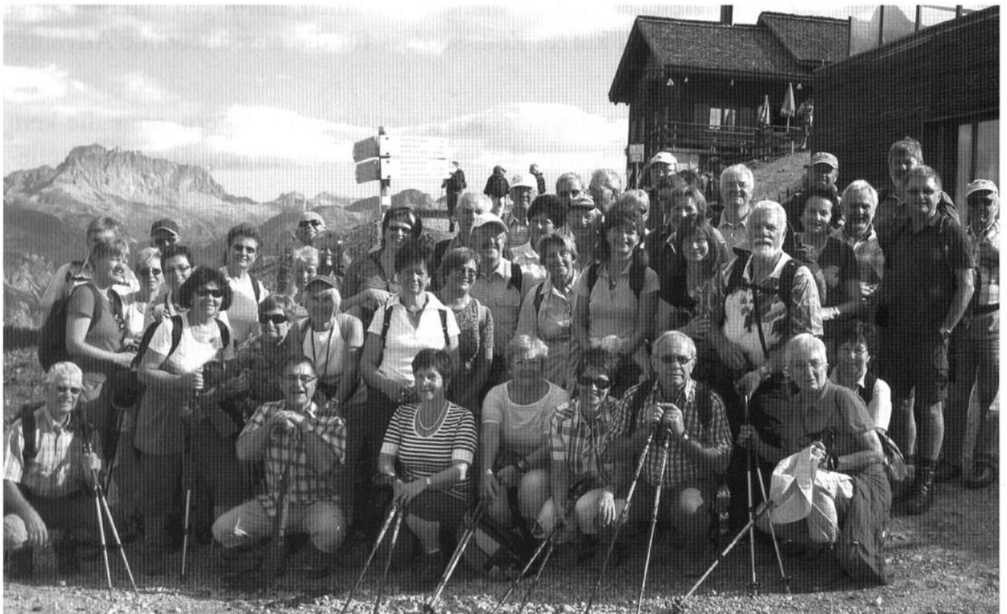
Spechte an der Kapellalpe im Montafon

Am ersten Tag stand nach der Ankunft ein Ortsrundgang mit einem Museumsbesuch auf dem Programm. Der zweite Tag begann mit einem Bergfrühstück auf dem Kristberg in