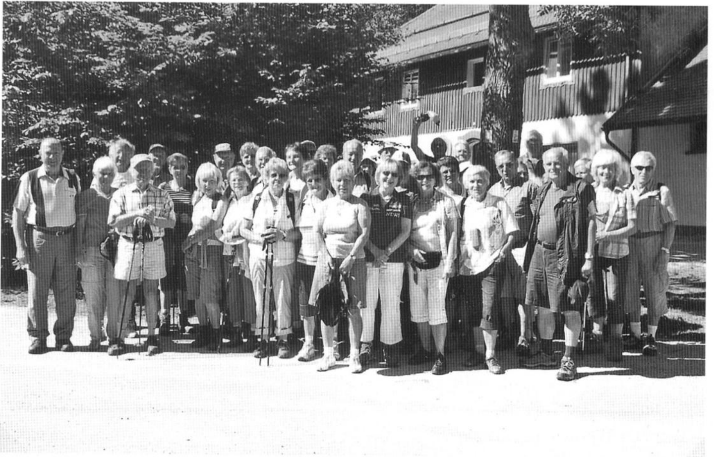
Mittwochswanderer an der Diensthütte der Bergwacht am Hohenbogen im Bayerischen Wald