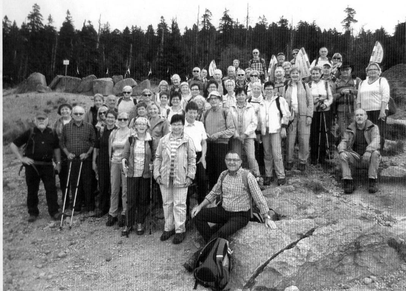
Die Wandergruppe des Spessartvereins im Harz.